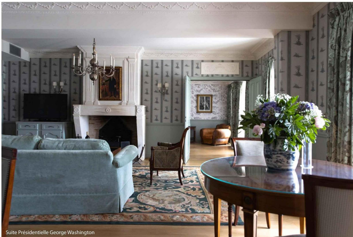
Suite Présidentielle George Washington

de hauts tabourets, on y sirote des cocktails créatifs tels que l'Heure d'Été à base de vieux pineau des Charentes, rhum épicé et infusion d'hibiscus. Une grande baie vitrée donne sur la fraîcheur d'un patio ombragé, remodelé dans le style d'un jardin de curé par le célèbre paysagiste Louis Benech. Fougères, herbes folles, hortensias à fleurs blanches ont envahi l'espace, des effluves de roses et de jasmin embaument l'air... L'escalier discret conduit aux chambres et suites avec vue sur le port ou le jardin, toutes inspirées de personnalités marquantes de la région, de leurs goûts, de leurs œuvres ou d'anecdotes : tissus, tableaux, reproductions, livres, bibelots... Parmi elles, coup de cœur pour la suite Présidentielle George Washington de 110 m 2 (on apprend que son ancêtre Nicolas Martiau était originaire de l'île de Ré), dont les quatre fenêtres offrent de jolies échappées sur le ballet des bateaux de pêche et de plaisance.